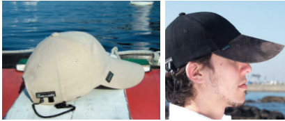
ブラック×ブラウンのみ ツバ部分はスエード素材

強い日差しの洋上で、効果的に日差しや紫外線を遮るロングバイザーキャップ。サイズは60cmまで調節可能です