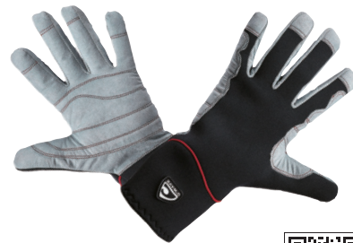
O'WAVE / グローブ STORM

2mmネオプレンとアマラ素材で、手を温かく保つ。グリップのよい冬用のグローブ。手首まで保護してくれるのがGOOD!