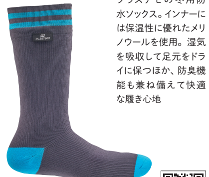
プラスチモ/Activ' Merino ウォータープルーフソックス

プラスチモの冬用防水ソックス。インナーには保温性に優れたメリノウールを使用。湿気を吸収して足元をドライに保つほか、防臭機能も兼ね備えて快適な履き心地