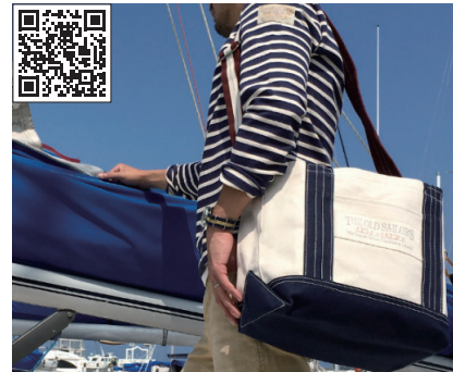
オールドセイラーズ/トート TOSB-016

シリーズ中、最もタフなバッグです。相当の重量を入れてもへこたれません。幅広のショルダーストラップが付いているので、重い荷物も楽に運べます