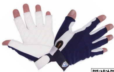
O'WAVE/ グローブ First ハーフフィンガー

スパンデックスと柔らかい革を使った伸縮性に優れたセーリンググローブ。全ての指先が覆われていないショートタイプです