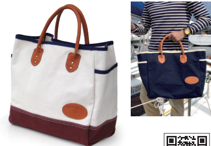
オールドセイラーズ/ トート TOSB-011

6号の超厚手帆布を使い、工業用ミシンの限界に挑む超頑丈トートです。マチが広めなので、幅のあるものも安定した状態で収納することができます