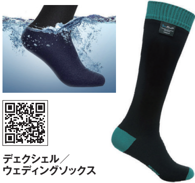
デクシェル/ ウェディングソックス

ひざ上のロングタイプのハイソックス。靴下がずれ落ちないようにしてある脚部のゴム部分にも防水加工。瞬間的にカフから上が水没した場合も役立つ