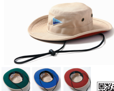
シースケープ／サンブレラ マリンハット・ベーシック

ボートカバーに使われる厚手の生地「サンブレラ」素材で作られた帽子です。ボートカバーのように貴方を風雨や紫外線から守ってくれます