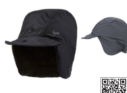
シールスキンス/ ウォーターブルーフ エキストラム コールドウェザーハット

完全防水、防風と優れた透湿性を持つ冬用キャップ。両耳から首元をカバーし、マイクロフリースライニングが保温と湿気をコントロールして冬も快適です