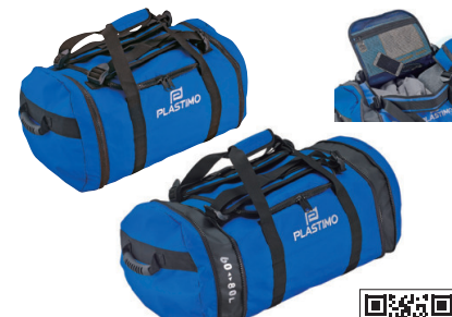
プラスチックモ/ダッフル エクステンダブル

両サイドのジッパーで、60~80Lまでサイズが変更できるバッグです。口が大きく開き、出し入れがラク。ショルダーとリュックの2WAYで使用可能