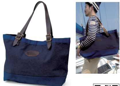
オールドセイラーズ/ トート TOSB-014

6号の超厚手帆布と革ベルトの組み合わせで、頑丈さはピカイチ。深いブルーカラーとちょっと幅広めのシンプルなデザインで、洗練された印象です