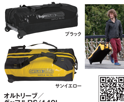
オ尔特リーブ/ダッフルRS/140L

ローラーシステムとハンドルの付いたダッフルです。段差や悪路でもスムーズに移動でき、パッド付きのショルダーストラップはバックパックとして使用可能