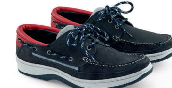
ネイビー(ヌバックレザー)

底から1枚の革で立ち上げて足先を包むように作られたモカシタイプ。内側のライニングには肌触りが良く、柔らかいキップレザー(牛革)を使用