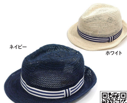
シブスベル／リボンハット

たたんでも元の形状に戻るサーモ糸を使った涼しいメッシュのマリンハット。汗止めの裏にサイズ調節機能をプラス。軽くて畳めるので持ち運びが便利です