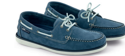
ブルー(ヌバックレザー)

メンズタイプに比べて幅が細身に作られています。ブルーのヌバックレザータイプは表面が起毛してあるので質感に温かみがあります