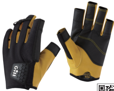
ギル/ プログローブショートフィンガー

プロスペックのセーリンググローブです。異なる素材を上手に組み合わせ、丈夫でやわらかい仕上がりに。クルーザー、ディンギーともにおすすめ