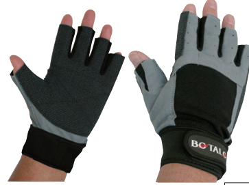
BOTALO/ 92ケブラーグローブ

手のひらをケブラーで補強し、タフな耐久性と強力なグリップ性を備えています。手首はベルクロで止められてしっかりフィットします