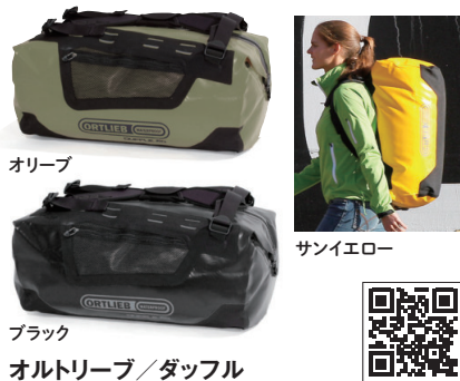
オ尔特リーブ/ダッフル

ドライスーツにも使用される防水ジッパー「TIZIP」を採用した完全防水のダッフルバッグ。背負うこともでき、いざというときにはつかまって浮くことも可能