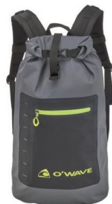
OWAVE/ウオータープルーフバック

IP66性能の防水バックパック。前面にはIP64性能のファスナー付き防水ポケットがついていて、また内側にもタブレットなどが入るポケットがあります