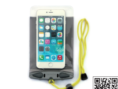
アクアパック / #358

大きめのスマホや、ミディアムサイズのGPSなどが収納できるサイズ。特許の「AQUA CLIP」で中身をガッチリガード。水深5メートルにも耐えられます