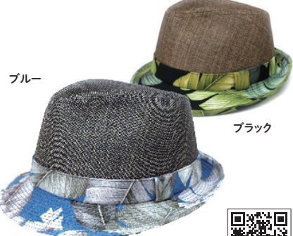
シブスベル／バカンスハット

和紙を編み上げた帽体と夏らしい柄の麻素材ブリムの組み合わせ。あご紐を取り付けられるようにベルトループが付いています