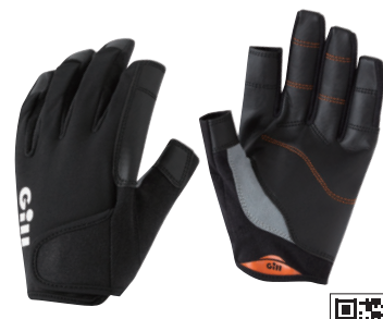
ギル/ チャンピオングローブ・ロング

縫い目のない指先、手の平を保護するラップアラウンド構造、手にフィットするプレシェイブ構造など、充実した機能を備えています