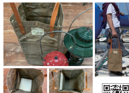
オールドセイラーズ/ ジェームスランタン トートバッグ

船乗りがその昔、ランタンをトートバッグに入れて運んだことがモチーフのバッグ。素材はパラフィン加工した10号帆布でポケットは外に3つ、内に1つ