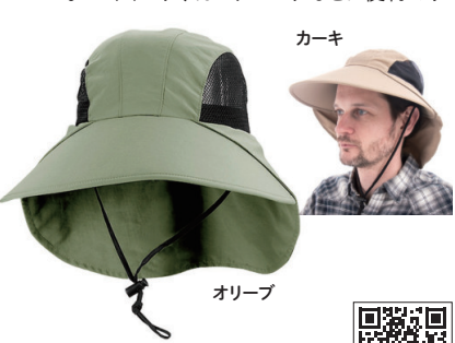
メガキャップ/ サンブロックUVカットハット

アウトドアハットの専門メーカー、メガキャップ社製。サイドは通気性の良いメッシュ張り、紫外線遮蔽率98.5%。ハイキング、ガーデニングなどに便利です