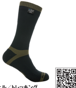
デクシェル/トレッキング

高い防水性と透湿性を持つソックス。靴が濡れても、足は濡れません。保温レベルは5段階中の4番目。名前はトレッキングですが、多用途に使えます