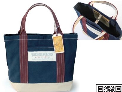
オールドセイラーズ/ トート TOSB-015

こちら6号の帆布を使った超頑丈な一品。胴帯仕様の持ち手でさらに強度アップ。内ポケット付き。ネイビーとワインのカラーリングも落ち着いた魅力