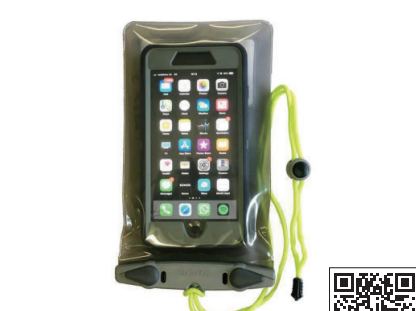
アクアパック / #368

#358より一回り大きいサイズで、大きめのスマホを耐衝撃ケースに入れたままの状態でも収納できます。もちろんそのまま通話や写真撮影も可能です!