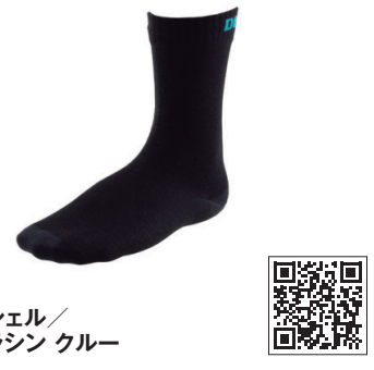
デクシェル/ ウルトラシン クルー

より薄いがコンセプトの軽量薄手の防水ソックス。表地は、耐摩耗性に優れたナイロンニット。摩擦などに強く、水を吸収しにくく、乾きやすさを求めた作り