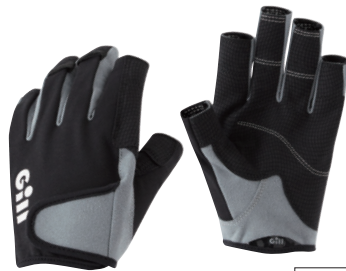
ギル/デッキハンドグローブ

インショア、ディンギーにぴったりのショートフィンガーグローブ。伸縮性に優れ、柔らかく手にフィット。水を吸収・保持したりせずグリップ力を発揮します