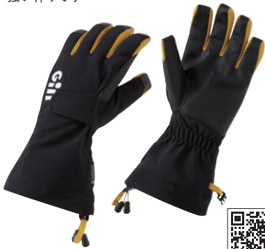
ギル/ヘルムスマングローブ

冬用グローブの決定版。もちろん透湿&完全防水で、掌の内側はデュラグリップ素材で補強し、摩擦にも強い作りです