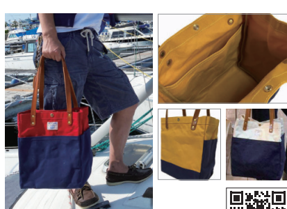
オールドセイラーズ/ ジェームス トートバッグ

パラフィン(ロウびき)加工した10号帆布で作られたトートバッグ。使うほどになじんできます。ショルダー部分は4mm厚のヌメ革を使用しています