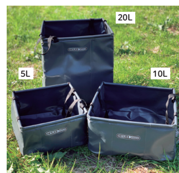
オ尔特リーブ/フォールディングボウル

商品番号 商品 サイズ 価格 73561 5L H12×W24×D24cm 4,950円 73562 10L H14×W30×D30cm 5,500円 73563 20L H28×W30×D30cm 6,600円 73564 50L H20×W62×D42cm 15,400円