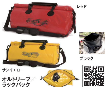
オ尔特リーブ/ラックバック

あらゆるシーンで活躍するドラム型防水ダッフルバッグ。キャリングハンドルと付属されているパッド入りショルダーストラップで快適に荷物を運べます