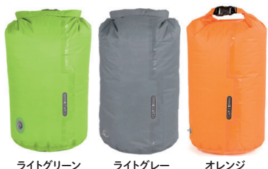
オ尔特リーブ/ドライバッグ PS10 バルブ付 22L

空気抜きバルブを装備しており、口を閉じてから圧縮可能。かさばる衣類などを入れて圧縮し、ダッフルバッグやバックパックにコンパクトに収納可能