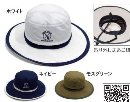
シブスベル／サニーハット

ツートンカラーのシブスベルのロゴ刺繍入りのハット。サイドにメッシュを入れて通気性を向上しています。あご紐の取り外しは可能