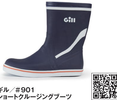
ギル/＃901 ショートクルージングブーツ

基本仕様は#909と同様で、100%ナチュラルラバーコンパウンド素材の滑りにくいレーザーカットソールを採用。着脱可能なクッションインナーソールです