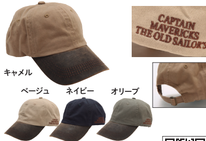
オールドセイラーズ/ オールドグランバ キャプテンキャップ2022

キャップの左側面には「CAPTAIN MAVERICKS THE OLD SAILOR'S」の刺繍入り。一つあるとコーディネートがぐっとしまります