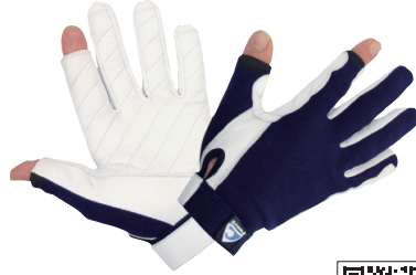
O'WAVE/ グローブ First ツーフンガー

グローブ First ハーフフィンガーのロングタイプで、親指と人差し指以外が覆われています。手のひらは2重のレザーで耐久性にも優れたグローブです