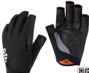
ギル/チャンピオングローブ

ギルの定番グローブ。手のひらと指はデュラグリップ素材で、優れた強度とグリップ力を兼ね備えています。グリップ力に優れ、耐摩耗性も高いアイテムです