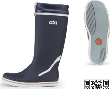
ギル/＃909 トールヨッティングブーツ

ナチュラルラバー素材製のノンスリップデッキブーツ。内側はクイックドライのポリエステルで、ブーツトップには磨耗防止のゴム加工が施されています