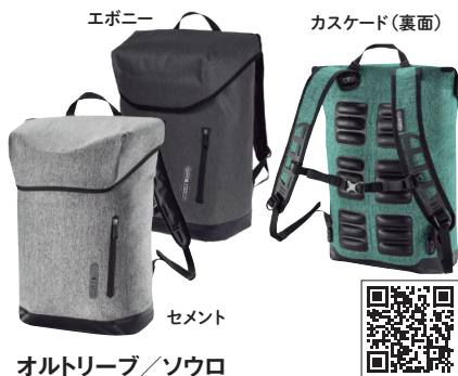
オ尔特リーブ/ソウロ

人間工学に基づいて設計されたショルダーストラップと、クッション性・通気性に優れた背面パッドで、快適な背負い心地。開閉部はマグネット式を採用