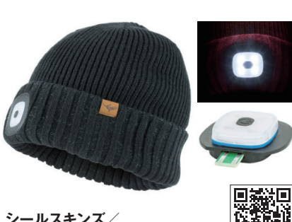
シールスキンス/ ウォーターブルーフ LEDロールカフ ビーニー

完全防水のキャップ前面にUSB充電式のLEDライトをセット。ライトの明るさは3段階で調節可能、フル充電で4時間使えます (lowレベル時)