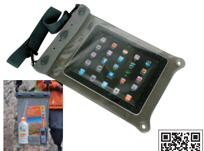
アクアパック / #668

iPadなどのタブレット端末を入れたまま操作が可能。大きめの防水ケースとして、貴重品や携帯、書類、小型カメラなどをまとめて入れられるのもポイント!