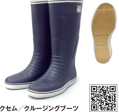
エクセム/クルージングブーツ

ソフトで動きやすいデッキブーツ。ノンスリップのレーザーカットソールで、つま先、かかと、すねは二重のラバーで補強されています