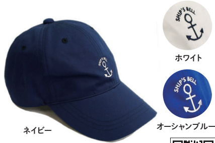
シブスベル／マリーナキャップ

オールシーズン被れる、ツイル素材のマリンキャップ。ワンポイント刺繍の錨が可愛く、シンプルで飽きがこないデザインです